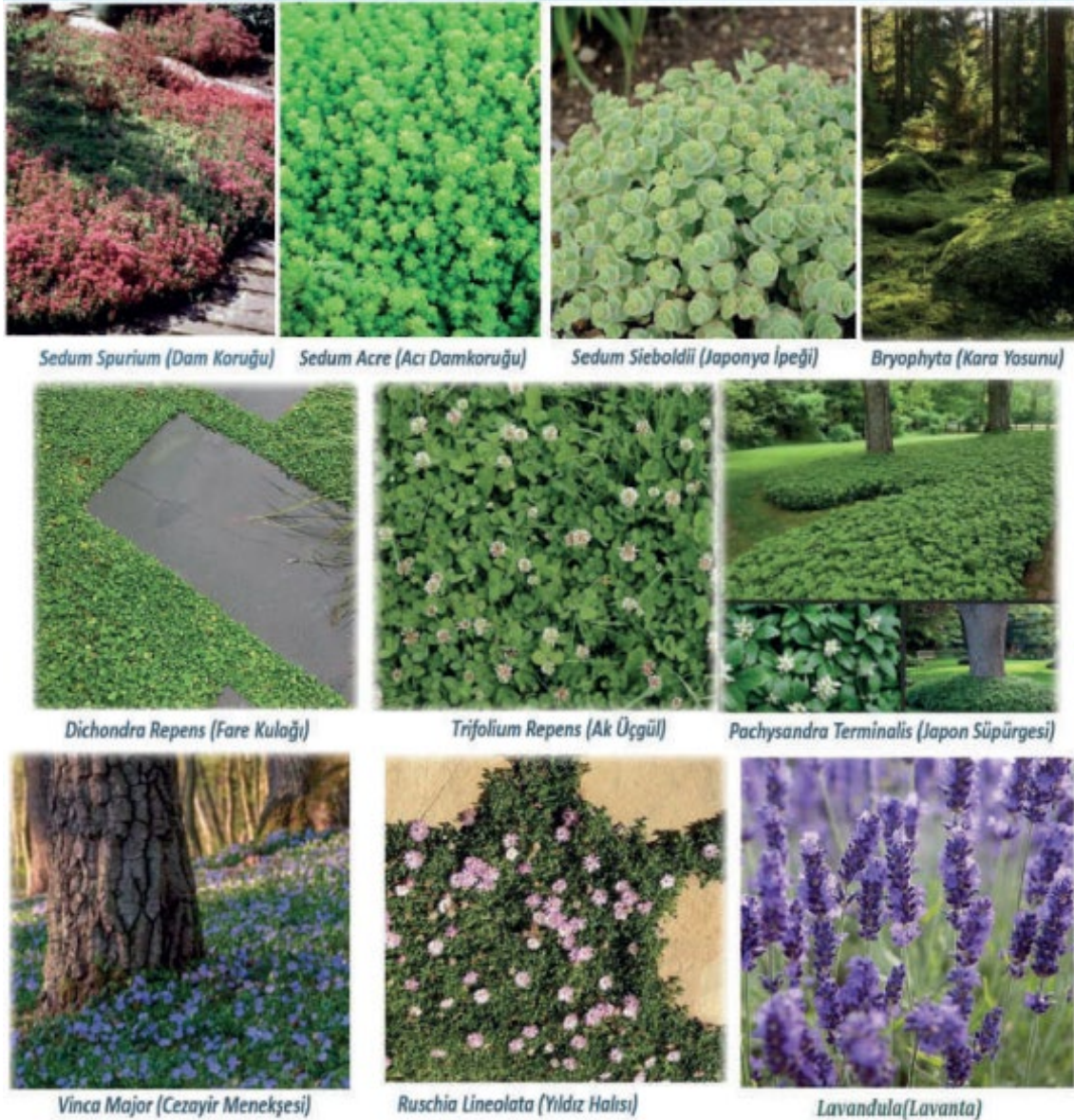
Şekil 6.1. Kurakçıl peyzaj amaçlı kullanılabilir bitki türleri

Aşağıda kurakçıl peyzaj amaçlı kullanılabilir bitki türleri verilmiştir. (Kaynak: Kurakçıl Peyzaj Uygulamaları Raporu, TC. Tarım Orman Bakanlığı,2024)