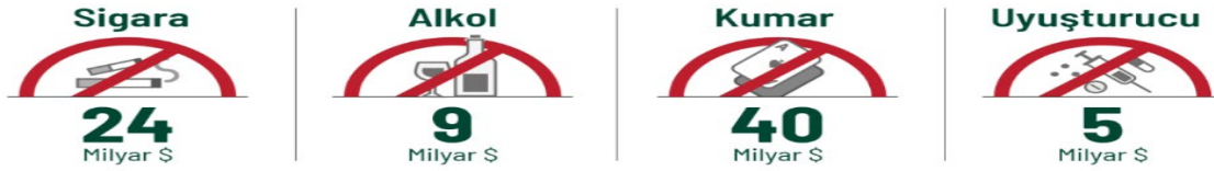
Şekil 1: Türkiye’de Sigara, Alkol, Uyuşturucu ve Kumar Bağımlılıklarının Yıllık Ekonomik Maliyeti (Türkiye Yeşilay Cemiyeti, 2025).

Bağımlılıkla ilişkili bir diğer önemli nokta da Türkiye’de ve dünyada bağımlılık yükünün toplumsal ve ekonomik maliyetler bakımından giderek artmasıdır. Bağımlılıkların maliyeti, üretkenlik kaybı ve sosyal hizmet yükü gibi dolaylı sonuçları da içermektedir (Türkiye Yeşilay Cemiyeti, 2025).