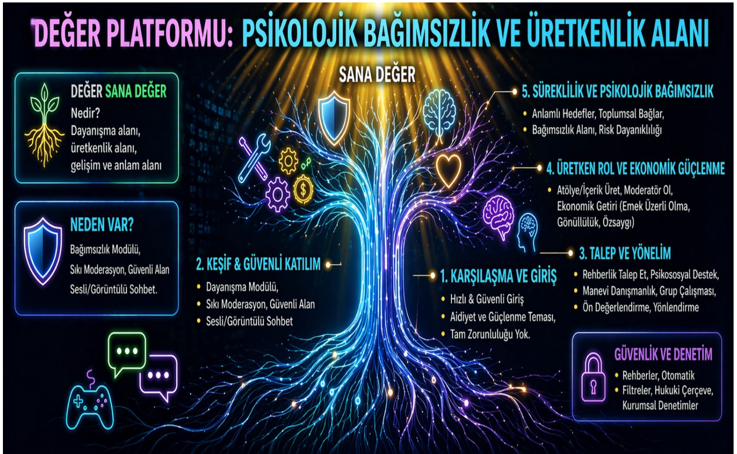
Şekil 4: DEĞER Platformu'nun Dijital Ekosistemi ve Psikolojik Bağımsızlık Yolculuğu

DEĞER Platformu, bağımlılığa zemin hazırlayan çok boyutlu risk alanlarına karşı bütüncül bir önleme yaklaşımı sunmaktadır. Topluluk modülü sosyal izolasyonu azaltmayı hedeflerken rehberlik yapısı kişisel kırılganlık alanlarına destek sunmakta; üretkenlik modülü ise oyun ve benzeri bağımlılık davranışlarının yerine anlamlı ve sürdürülebilir uğraşlar koymaktadır. Bu yönüyle DEĞER, bağımlılığı besleyen psikososyal koşulları dönüştürmeyi hedefleyen önleyici bir model sunmaktadır.